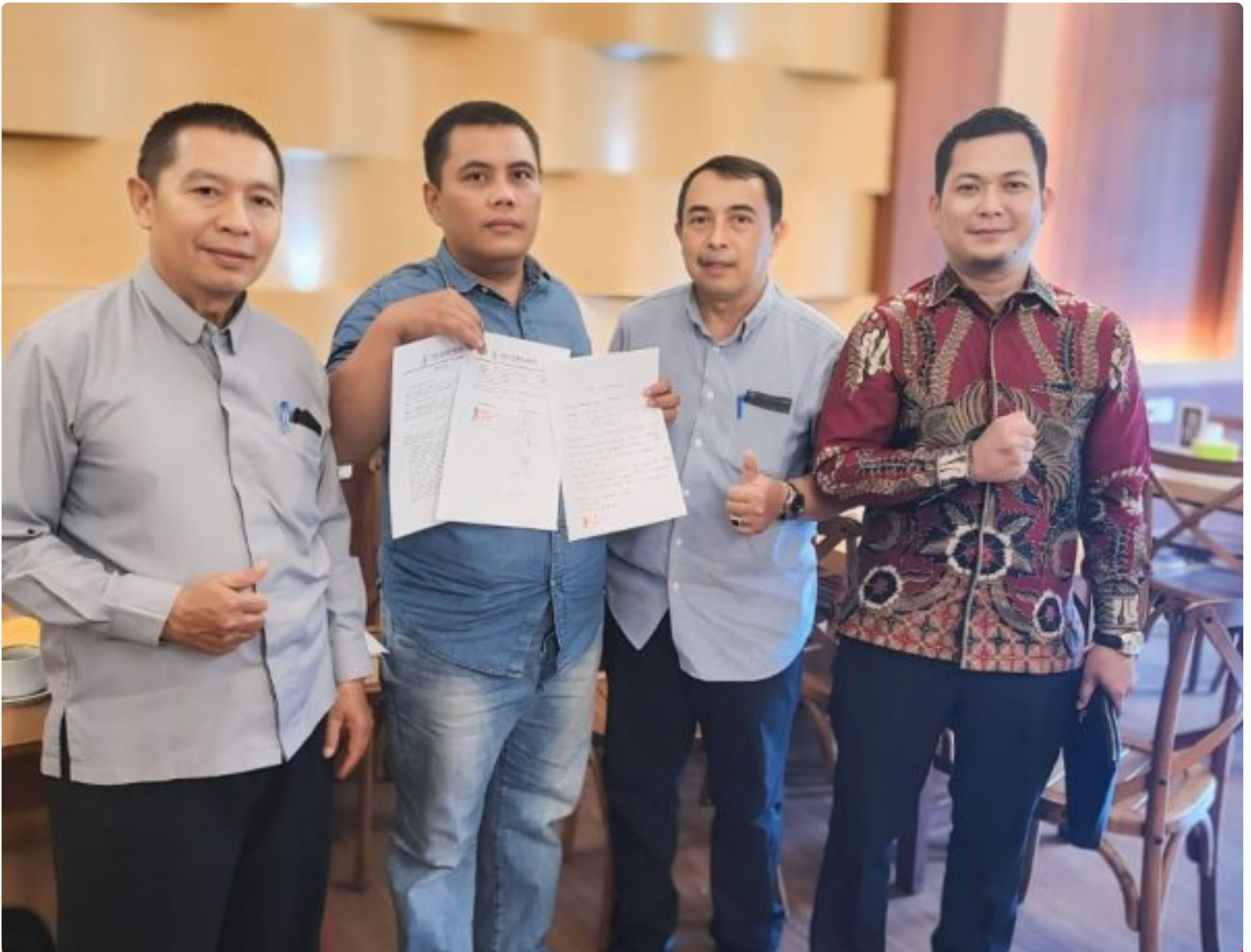
Kuasa Hukum Ningto Wahyu Dens & Partners Lawfirm di perkara Dugaan Pemalsuan Data dan Kredit Fiktif di Bank BRI Unit Kalideres.

JAKARTA, JNI - Seorang bekas nasabah Bank BRI, yang dikenal dengan inisial NW, melaporkan dugaan pemalsuan data dan kredit fiktif yang melibatkan oknum pegawai Bank BRI Unit Kalideres.